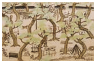
「真夏の太陽にいでむモダンアート野外実験展」会場図 制作年不詳 © The Estate of Kazuo Shiraga

兵庫県・芦屋を発祥とする前衛美術グループ「具体美術協会」(「具体」、1954-1972)には、当時の若き前衛美術家が集いました。1950年代後半には芦屋公園の松林での「真夏の太陽にいでむモダンアート野外実験展」(1955年)を皮切りにして、穏健なモダニズムの枠をこえて型破りな絵画やパフォーマンスを発表し、これらの「具体」の革新的な活動は、今日、国際的に高く評価されています。阪神南エリア(尼崎市・西宮市・芦屋市)で花開き、展開された「具体美術協会」の魅力についてぜひ、知る、見る、体験してください。